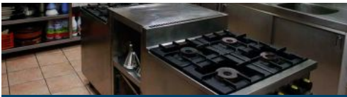
Imagen de la cocina de la Sociedad Gastronómica Los Sitios