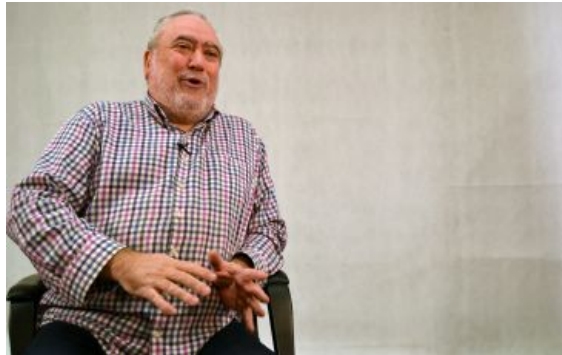
La Sociedad Gastronómica Cultural Los Sitios está ubicada en el centro de Zaragoza

En una bodega del siglo XVII, en pleno centro de Zaragoza, se encuentran las cocinas que permiten deleitarse de la mejor comida a los socios de la Sociedad Gastronómica Cultural Los Sitios. 20 años después de su apertura siguen tan vivos como siempre, reivindicando el valor de la cocina aragonesa, que "debe salir del cordero con patatas".