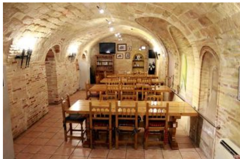
El comedor de la sociedad tiene un aforo de 49 personas gracias a sus dos salas

Respuesta.- El funcionamiento es muy sencillo. Se junta una serie de gente con un único objetivo: guisar y cocinar. Como si fuera un restaurante pero con unas instalaciones particulares. El sistema es muy simple: la sociedad provee de una serie de cosas como aceite, sal, azúcar, patatas, etc., los usuarios lo cogen cuando van a cocinar, rellenan un sobre con las bebidas y todo lo que han cogido, se suma y se divide entre las personas que están comiendo.